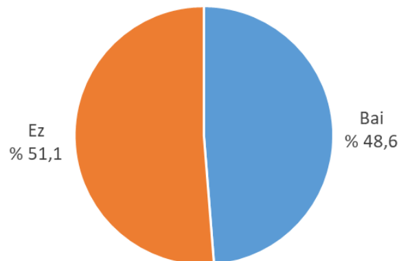
Lanpostu baterako elkarriketaren bat edo hautaketa-prozesuren batean parte hartu duten 15 eta 29 urte bitarteko gazteak (%)