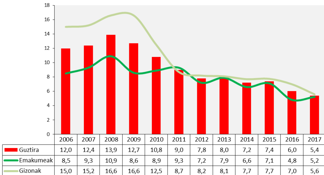
Euskadiko 18 eta 24 urte bitarteko gazteen garai aurreko eskola-uzte tasa 2017an, sexuaren arabera (%)