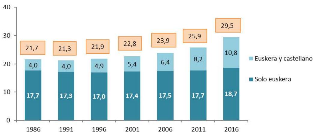
Evolución del porcentaje de jóvenes de Euskadi de 15 a 29 años cuya lengua materna ha sido el euskera (solo o junto con el castellano)